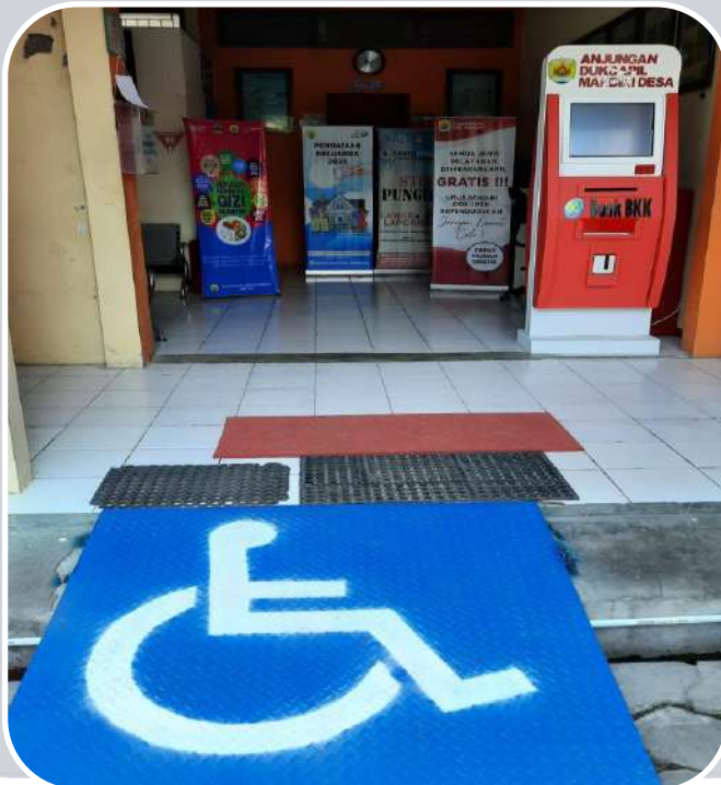
jalur khusus disabilitas