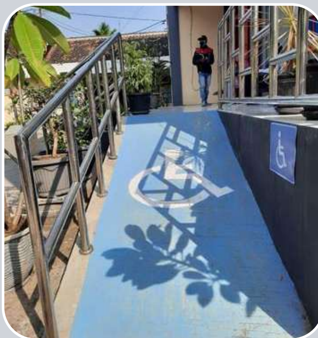
jalur khusus disabilitas