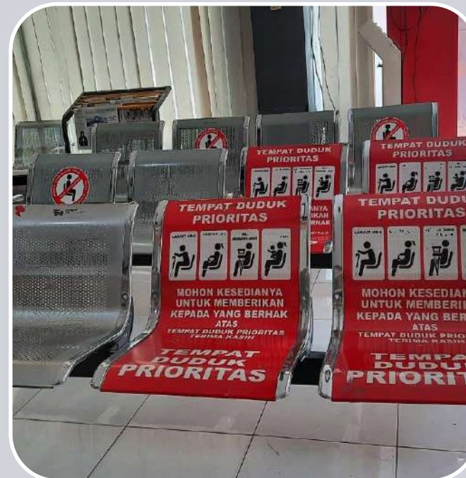
kursi pemohon prioritas (orang tua, ibu hamil, ibu menyusui, disabilitas)