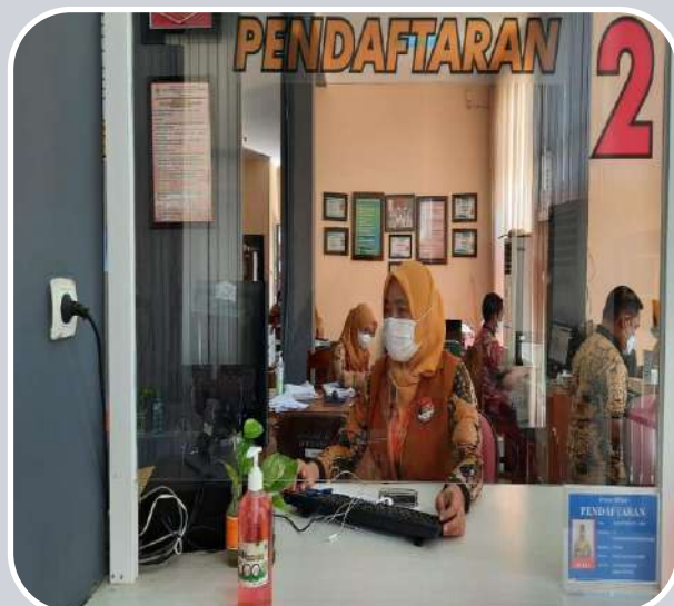
LOKET 2 PENDAFTARAN