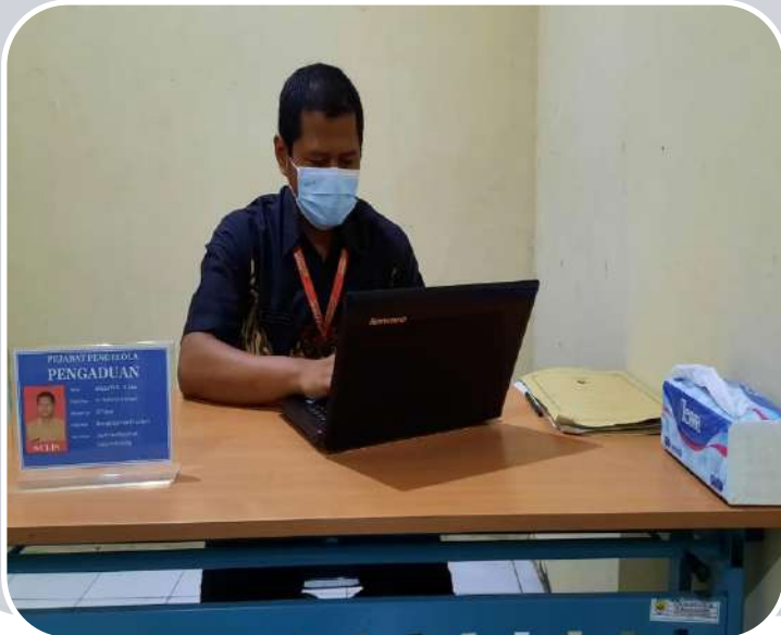
PEJABAT PENGELOLA PENGADUAN