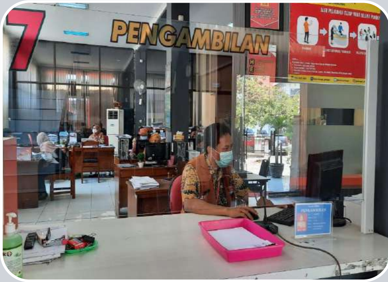
LOKET 7 PENGAMBILAN