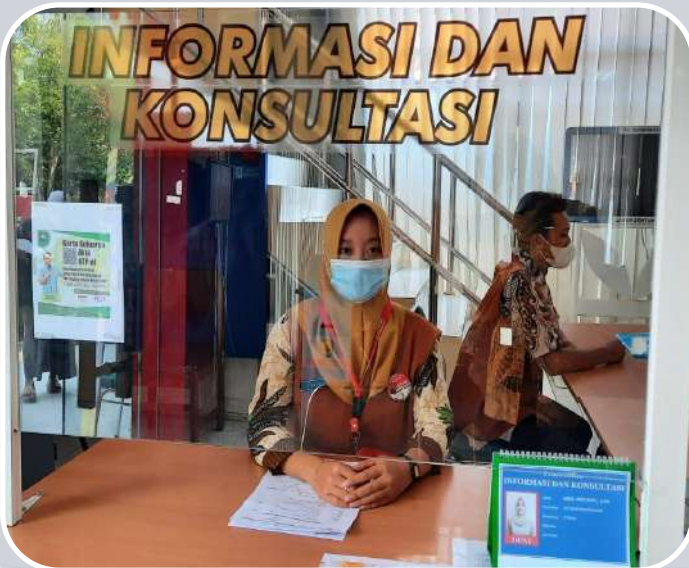
INFORMASI DAN KONSULTASI