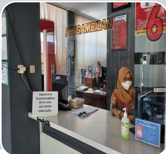
LOKET 6 PENGAMBILAN