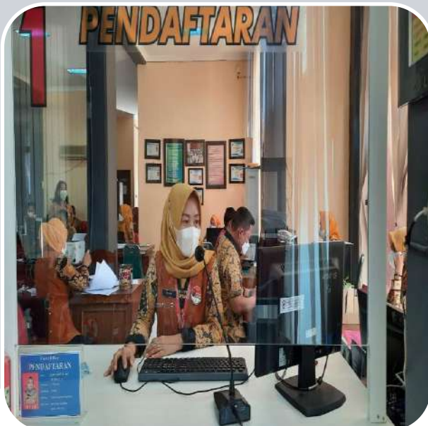
LOKET 1 PENDAFTARAN