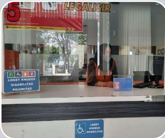
LOKET 5 - LEGALISIR - PEMOHON DISABILITAS DAN PRIORITAS