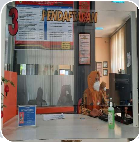
LOKET 3 PENDAFTARAN