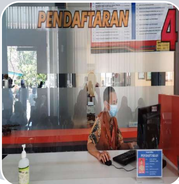
LOKET 4 PENDAFTARAN